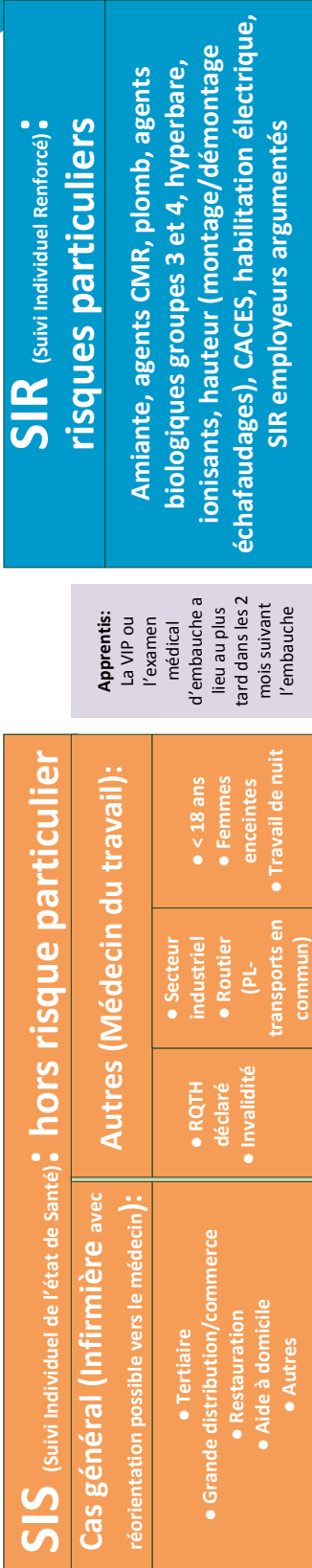
Schéma du suivi individuel de l'état de santé retenu par le SSTMC

Apprentis: La VIP ou l'examen médical d'embauche a lieu au plus tard dans les 2 mois suivant l'embauche